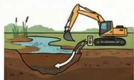
KŪDRAS IEGUVE UN SĀKOTNĒJĀ SADALE

Visa iegūtā kūdra: Emisijas mītrāju apsaimniekošanā (ieguves gads)