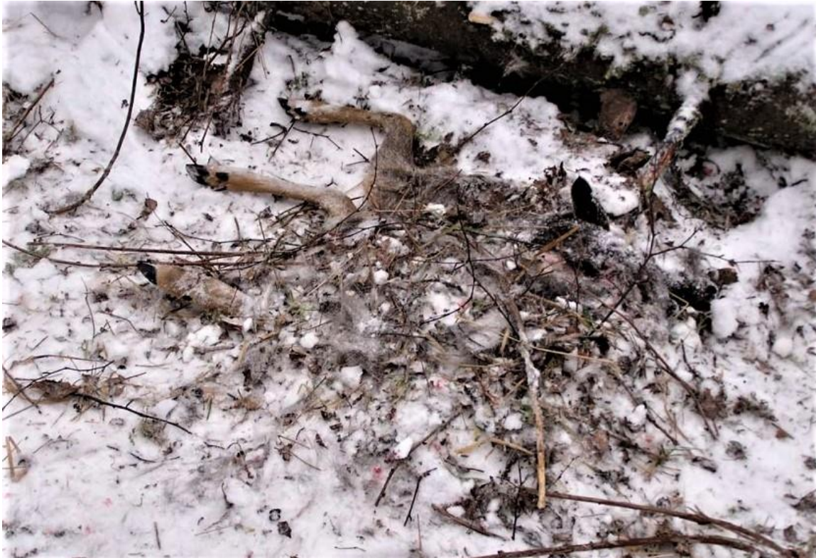
Lūša ar zariem apslēptas stirnas ķermenis