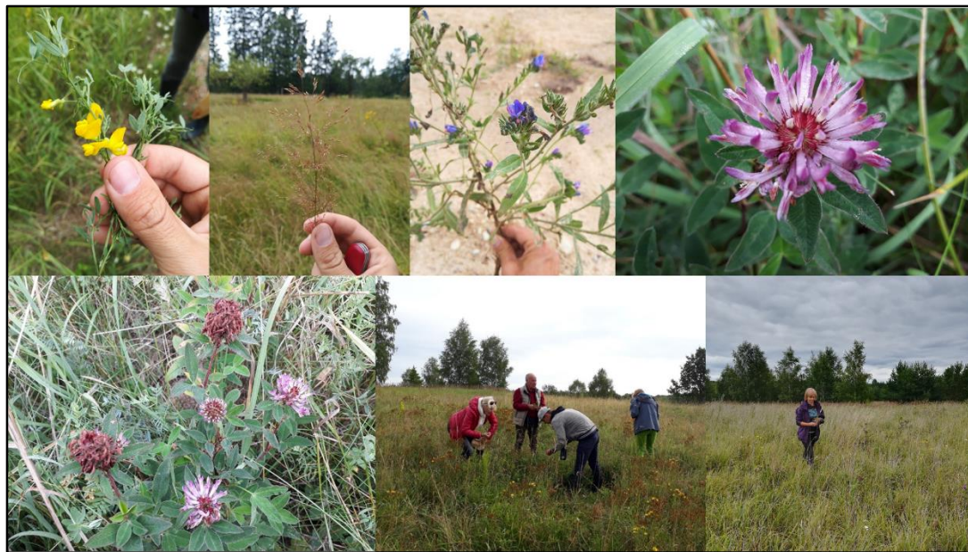
4. attēls. Daudzgadīgo zālaugu ģenētisko resursu paraugi un ievākšana