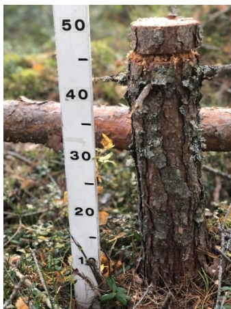
1. attēls. Priedes celms ar dažādu sēņu izolātu kolonizētu skaidu substrātu.

2021. gada 20. oktobrī tika vadīta lekcija LLU MF 3. kursa studentiem, kurā tika diskutēts arī par pētījuma laikā iegūtajiem rezultātiem un atziņām (2. attēls). 2021. gada 17. novembrī tika sagatavots ziņojums “ Expansion of root rot fungi Heterobasidion spp. genotype in a Norway spruce stand on a Oxalidosa forest type and biological control of root rot, lai piedalītos Natural Resources Institute Finland (Luke) ” rīkotajā vebinārā “ Seminar on Forest and Plant Health ”, uzstājās 10 ziņotāji no 4 valstīm, kopsavilkumi būs pieejami tiešsaitē. 2021. gada 25. novembrī par pētījuma rezultātiem ziņots 6 th international conference “ Sustainable management of natural resources – a basic condition for succesful socio-economic development in the period of implemetion of the new environemtal policy of the European Union ” ar ziņojumu “ Biological control of Heterobasidion root rot using Latvian fungal strains ”.